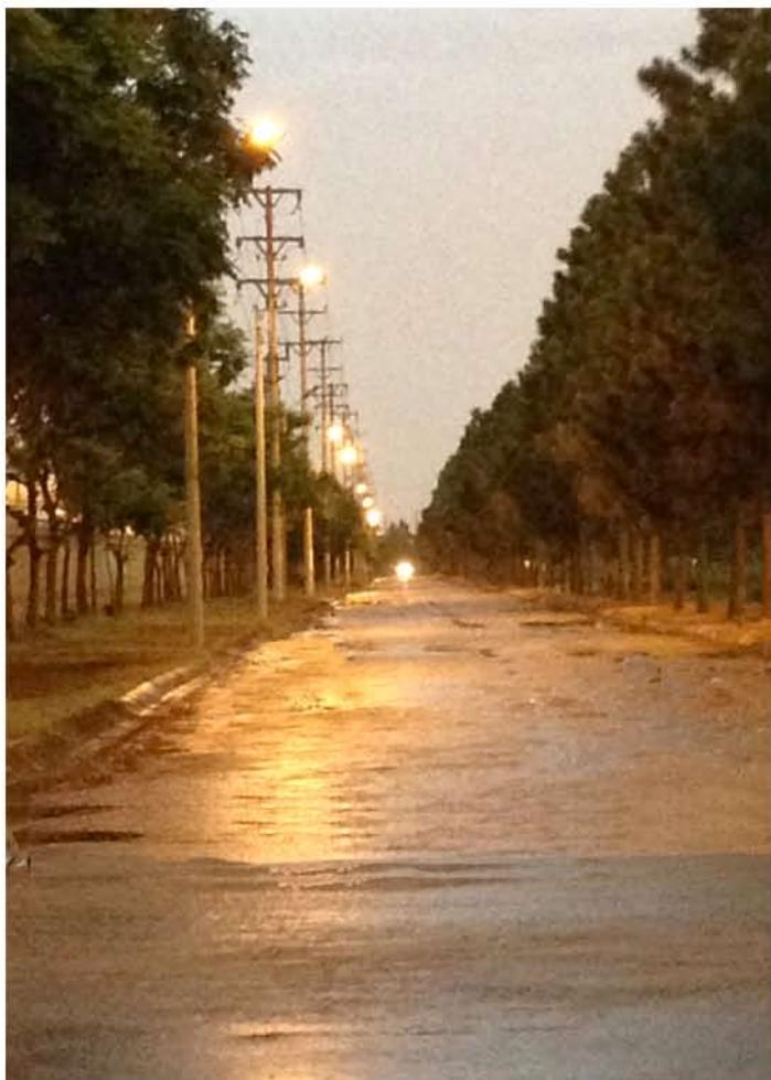
Hoàn thiện hệ thống chiếu sáng Khu công nghiệp