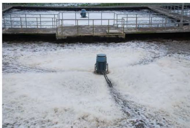
Nhà máy xử lý nước thải nâng cấp lên loại A theo tiêu chuẩn Việt Nam

Đảm bảo an toàn và nâng cao chất lượng dịch vụ và phục vụ trong khu công nghiệp