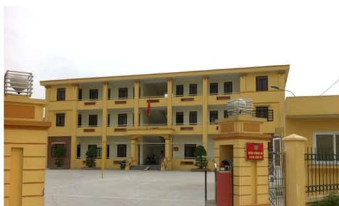
Xây dựng đồn công an trong Khu công nghiệp

Với sự nâng cấp này, khu công nghiệp Quế Võ hi vọng các doanh nghiệp đầu tư sẽ hoàn toàn yên tâm với chất lượng dịch vụ cũng như hạ tầng cơ sở của khu công nghiệp