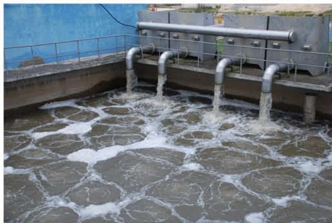
Nâng cấp nhà máy cung cấp nước sạch

Ngoài ra, việc chiếu sáng trong khu công nghiệp cũng đã hết sức được chú trọng bằng việc toàn bộ đường giao thông được lắp đèn chiếu sáng với công suất lớn.